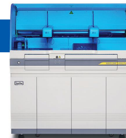
MAGLUMI™ 4000 PLUS