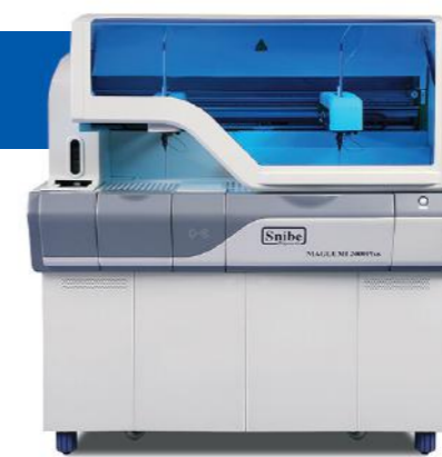
MAGLUMI™ 2000 Plus